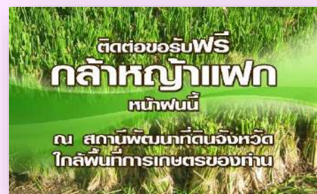
1.4) กล้าหญ้าแฝก