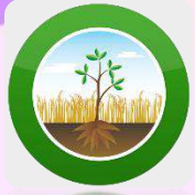
2.3) LDD Zoning