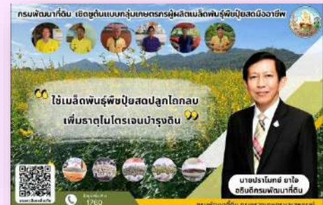
1.2) เมล็ดพันธุ์พืชปุ๋ยสด