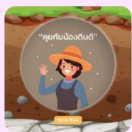
2.1) AI Chat bot คุยกับน้องดินดี