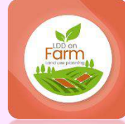
2.4) LDD On Farm