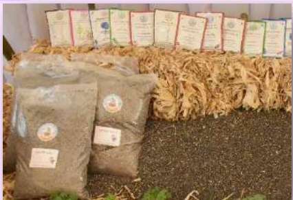
1.5) ปุ๋ยหมัก