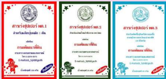
1.1) ผลิตภัณฑ์สารเร่ง พด.