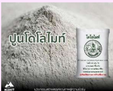
1.3) ปุ๋ยเพื่อการเกษตร