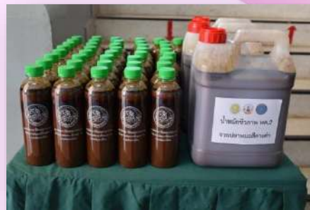
1.6) น้ำหมักชีวภาพ