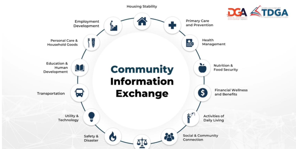
ภาพที่ ๒ Community Information Exchange

การปรับใช้ AI ภายใต้นโยบาย Citizen-Centric Government การขับเคลื่อนเทคโนโลยี Generative AI ในภาครัฐและประชาชน จำเป็นต้องปรับเปลี่ยนกระบวนทัศน์จากการทำงานตามภารกิจหน้าที่ ไปสู่การเป็น “รัฐบาลที่ยึดถือประชาชนเป็นศูนย์กลาง” (Citizen-Centric Government) อย่างแท้จริง โดยภาครัฐต้องปรับมุมมองที่มีต่อประชาชนจากการเป็นเพียงผู้รับบริการสู่การเป็น “ลูกค้าคนสำคัญ” ที่ต้องได้รับความพึงพอใจสูงสุด หัวใจสำคัญของการดำเนินการคือ “การทำงานเชิงรุก” โดยการนำ AI มาใช้ต้องตั้งอยู่บนคำถามพื้นฐานที่ว่า “ประชาชนจะได้รับประโยชน์และมีความสะดวกสบายเพิ่มขึ้นเพียงใด” และ “เทคโนโลยีนี้สามารถแก้ไขปัญหาได้ตรงจุดหรือไม่” การนำ AI มาใช้ในลักษณะนี้จะช่วยให้รัฐบาลสามารถตอบสนองความต้องการของประชาชนได้โดยไม่ต้องรอให้เกิดการเรียกร้องหรือร้องเรียน เป็นการสร้างระบบราชการที่โปร่งใส มีประสิทธิภาพ และสามารถคาดการณ์ความต้องการของประชาชนในอนาคตเพื่อส่งมอบความคุ้มค่าสูงสุดแก่สังคม