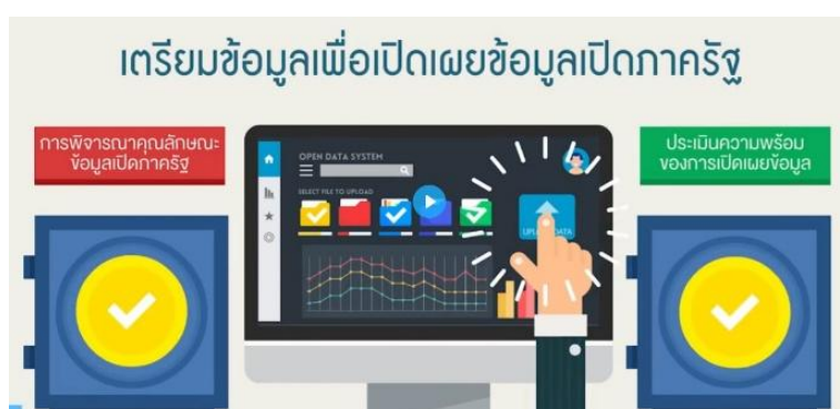
ภาพที่ ๒ การเตรียมข้อมูลเพื่อเปิดเผยข้อมูลภาครัฐ