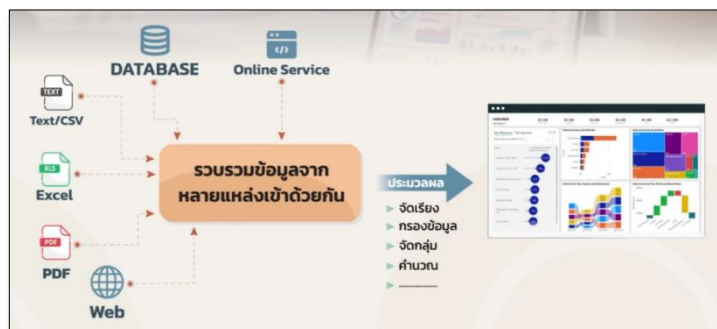
ภาพที่ ๑ การนำ Data มาใช้ประโยชน์

Data Visualization คือ การนำข้อมูลหรือ Data ที่ได้มาจากแหล่งข้อมูลต่าง ๆ มาวิเคราะห์ประมวลผล แล้วนำเสนอออกมาในรูปแบบที่มองเห็นและทำความเข้าใจได้ด้วยตา ซึ่งเป็นการใช้ศิลปะของการเล่าเรื่องด้วยภาพเพื่อช่วยให้สมองของมนุษย์ประมวลผลข้อมูลได้รวดเร็วกว่าการอ่านตัวหนังสือ ธรรมชาติของมนุษย์สามารถจดจำรูปแบบและสีเส้นได้ดีกว่าตารางตัวเลข การทำ Visualization ที่ดีจะช่วยให้เรามองเห็นสิ่งที่เรียกว่า "Insight" หรือข้อมูลเชิงลึก ซึ่งประกอบด้วย 3 ส่วนหลัก ได้แก่ การมองเห็นแนวโน้ม (Trend) ว่าสถานการณ์กำลังดีขึ้นหรือแย่ลง การมองเห็นสิ่งผิดปกติ (Outlier) ที่อาจเป็นข้อผิดพลาดของข้อมูลหรือโอกาสทางธุรกิจที่ซ่อนอยู่ และการมองเห็นรูปแบบ (Pattern) พฤติกรรมที่เกิดขึ้นซ้ำ ๆ เพื่อนำไปใช้ในการพยากรณ์และวางแผนในอนาคต