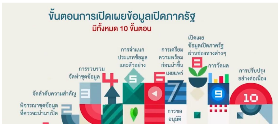
ภาพที่ ๓ ขั้นตอนการเปิดเผยข้อมูลภาครัฐ