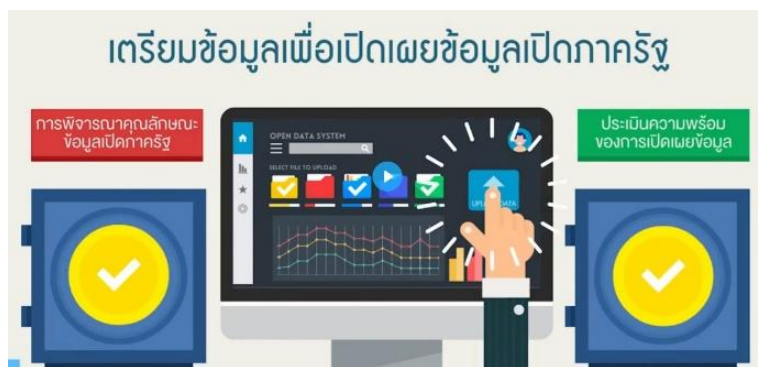
ภาพที่ ๒ การเตรียมข้อมูลเพื่อเปิดเผยข้อมูลภาครัฐ