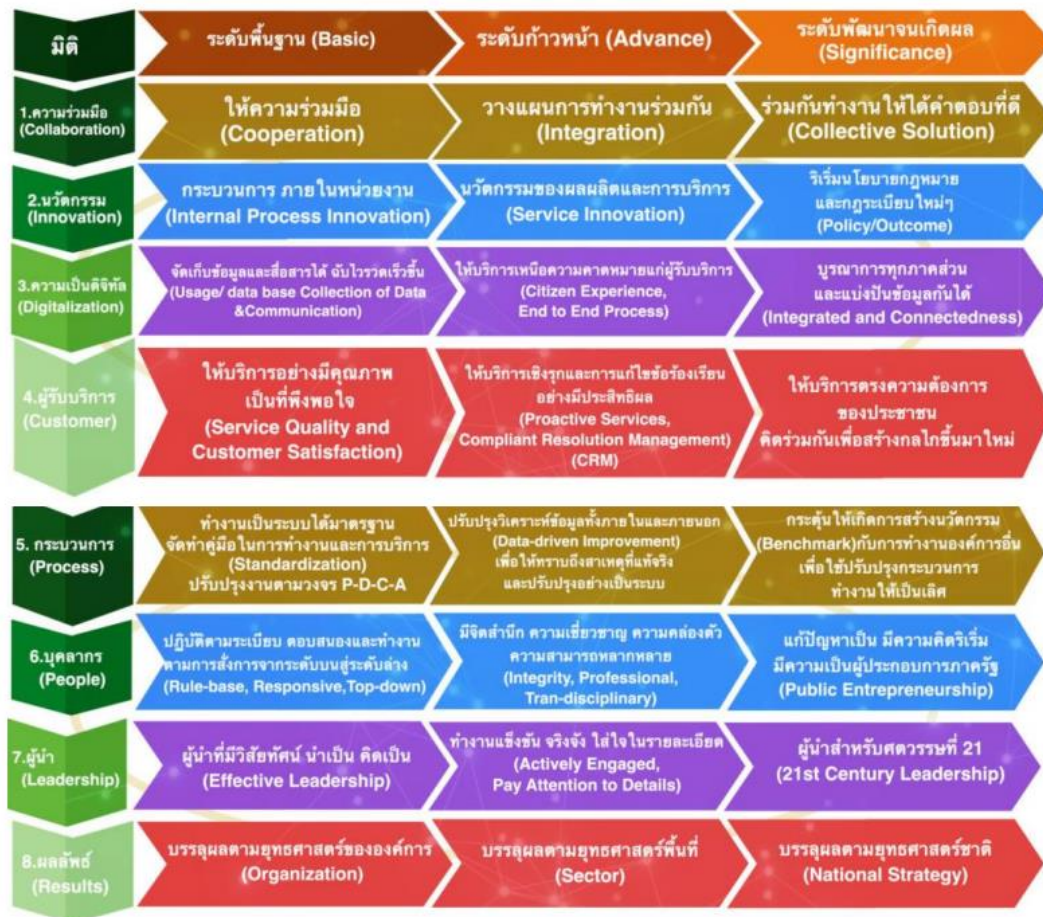
ที่มา : คู่มือการประเมินสถานะของหน่วยงานภาครัฐในการเป็นระบบราชการ ๔.๐ สำนักงานคณะกรรมการพัฒนาระบบราชการ

๓. ระดับพัฒนาจนเกิดผล (Significance) ระดับคะแนน ๔๗๐ - ๕๐๐ คะแนน การดำเนินการที่มีประสิทธิผล มีนวัตกรรม คิดเป็นคิดเก่ง คิดเชื่อมโยงและบูรณาการให้ได้ผลงานมีประสิทธิผล และเกิดนวัตกรรม ดำเนินเรื่องในทุกหมวดอย่างเป็นระบบ ถ่ายทอดแนวทางการเกิดประสิทธิผล ตอบสนองพันธกิจเชื่อมโยงความต้องการบรรลุเป้าหมายการเป็นระบบราชการ ๔.๐