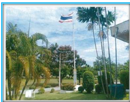
ภาพที่ ๕ รูปภาพเสาธง รหัสสิ่งปลูกสร้าง OH๐๕-๐๐๑-๐๑๓๑ สพด.เพชรบุรี#๑ รหัสสินทรัพย์ ๑๑๐๐๐๐๐๓๐๖๓ ปีที่ได้มา ๒๕๓๑ ราคาทุน ๒๐,๐๐๐ บาท