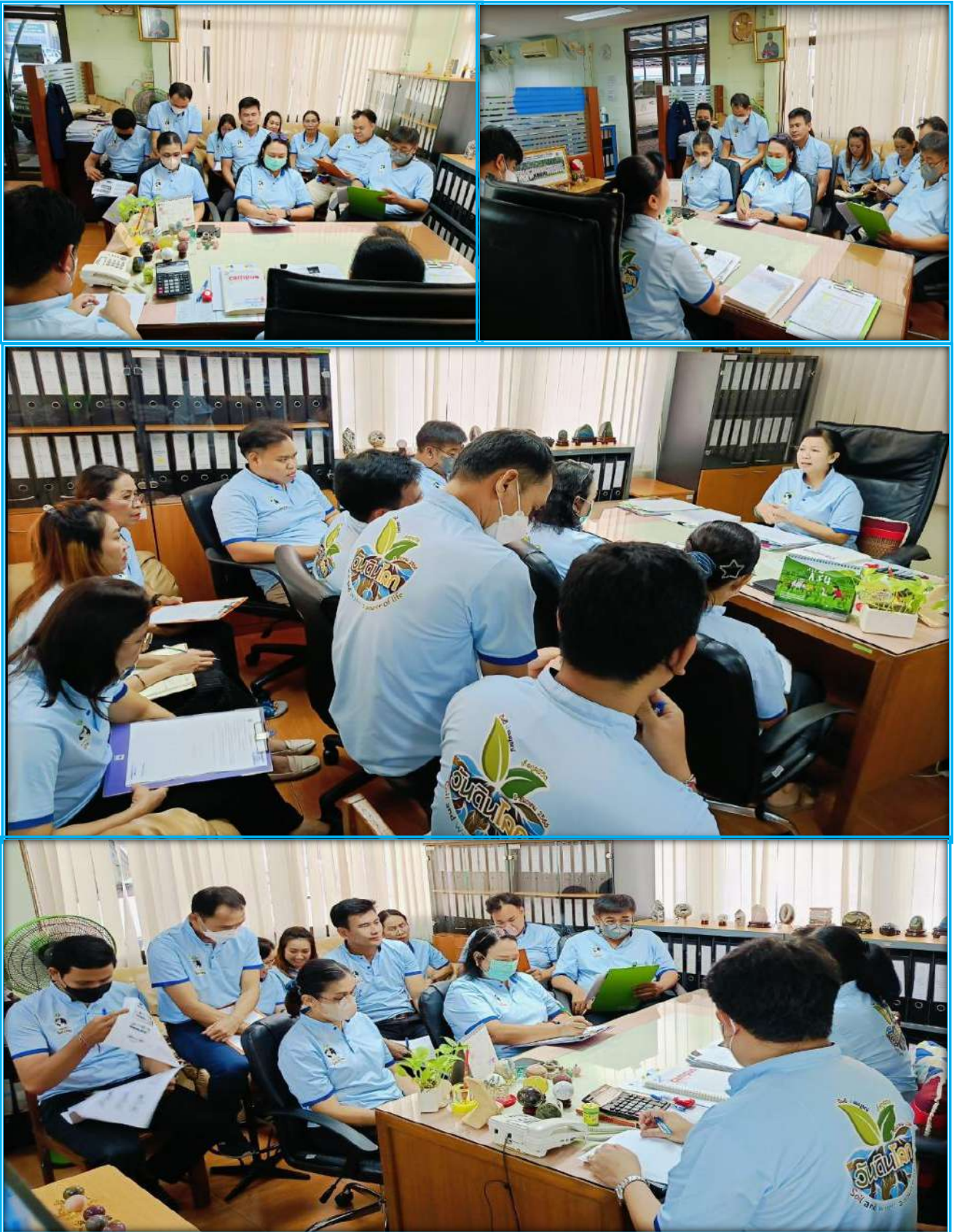
ภาพที่ ๑๓ รูปภาพการสอนงานของกลุ่มบริหารสินทรัพย์ กองคลัง