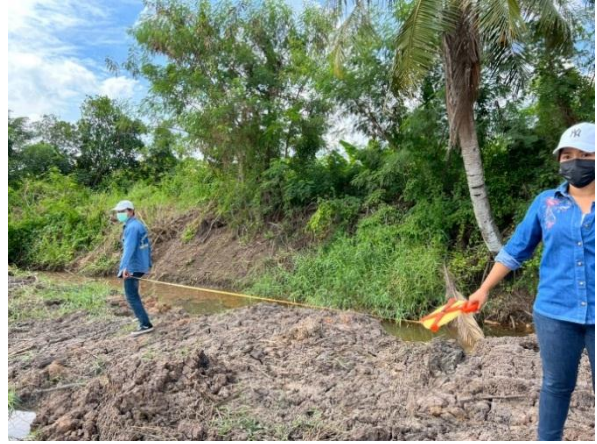
ภาพที่ ๒ ภาพการดำเนินกิจกรรมจัดทำระบบโครงสร้างพื้นฐานการพัฒนาพื้นที่ทุ่งรังสิต ณ บ้านลำบัว หมู่ที่ ๗ ตำบลหนองจรเข้, บ้านคลองห้า หมู่ที่ ๒, บ้านหนองโรง หมู่ที่ ๓, บ้านคลองสิบ หมู่ที่ ๔, บ้านศรีปทุม หมู่ที่ ๘, บ้านทหารผ่านศึก หมู่ที่ ๑๐ ตำบลหนองโรง อำเภอนองแคว จังหวัดสระบุรี