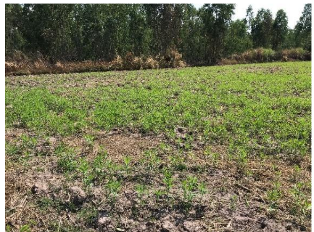
ภาพที่ ๕ กิจกรรมที่ส่งเสริมการปลูกพืชปุ๋ยสดปรับปรุงบำรุงดิน (ปอเทือง)