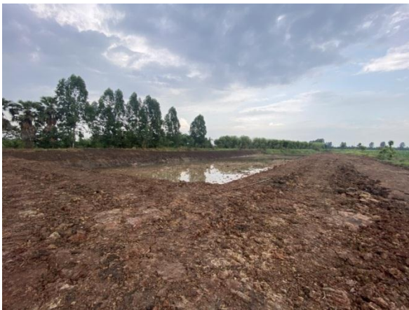
๑.๒ สัญญาเลขที่ ส.๑๕/๒๕๖๕ ณ บ้านคันลำ หมู่ที่ ๓ ตำบลหนองหมู อำเภอวิหารแดง จังหวัดสระบุรี