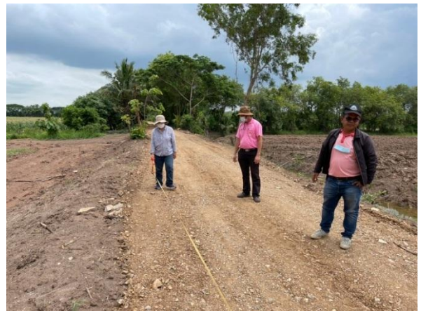
ภาพที่ ๓ ภาพการดำเนินงานกิจกรรมจัดทำระบบโครงสร้างพื้นฐานการพัฒนาพื้นที่ทุ่งรังสิต ณ บ้านคั่นลำ หมู่ที่ ๓ ตำบลหนองหมู อำเภอวิหารแดง จังหวัดสระบุรี