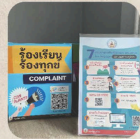
*กล่องรับเรื่องร้องเรียน

มีการเผยแพร่ช่องทางที่สามารถติชม หรือ แสดงความคิดเห็นในลักษณะ สื่อสารสองทาง ต่อการปฏิบัติงาน หรือการให้บริการ