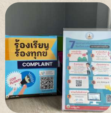
*กล่องรับเรื่องร้องเรียน

มีการเผยแพร่ช่องทางที่สามารถติชม หรือ แสดงความคิดเห็นในลักษณะสื่อสารสองทาง ต่อการปฏิบัติงาน หรือการให้บริการ