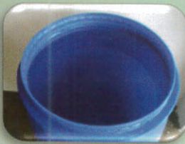
น้ำ 10 ลิตร