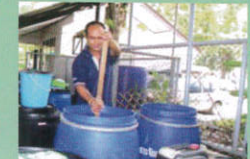
5. คนวัสดุให้เข้ากัน และคน 1-2 วันต่อครั้ง ปิดฝาถังให้สนิท และตั้งไว้ในที่ร่ม