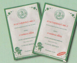
สารเร่งซูเปอร์ พด.2 1 ซอง (25 กรัม)