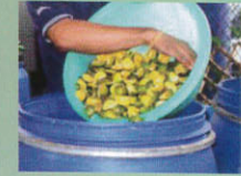
4. ใส่วัสดุลงในถังหมัก