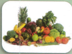
ผักหรือผลไม้ 40 กิโลกรัม