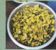
1. สับวัสดุให้เป็นชิ้นเล็ก ๆ