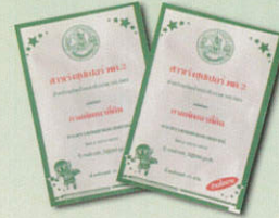
สารเร่งซูเปอร์ พด.2 1 ซอง (25 กรัม)