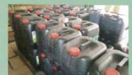
7. กรองน้ำหมักชีวภาพใส่ถังที่บ่ม และเก็บไว้ในที่ร่มพร้อมนำไปใช้