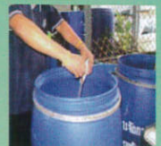
3. ใส่สารเร่งซูเปอร์พด.2 ในถังหมัก