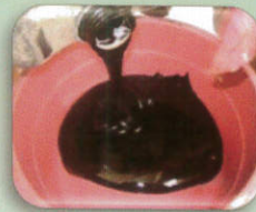
กากน้ำตาล 10 กิโลกรัม หรือน้ำตาลทราย 5 กิโลกรัม