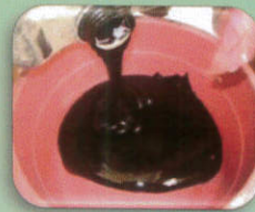
กากน้ำตาล 10 กิโลกรัม หรือน้ำตาลทราย 5 กิโลกรัม