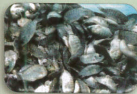
ปลา 40 กิโลกรัม