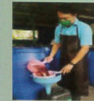
6. กรองวัสดุออกเมื่อหมักสมบูรณ์ สังเกตจากไม่พบฟองก๊าซ กลิ่นแอลกอฮอล์ลดลง มีกลิ่นเปรี้ยวเพิ่มขึ้น และมีค่าความเป็นกรดเป็นด่าง 3-4 ให้กรองวัสดุออก