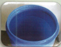
น้ำ 10 ลิตร