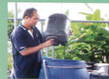
2. ผสมกากน้ำตาลกับน้ำในถังหมัก